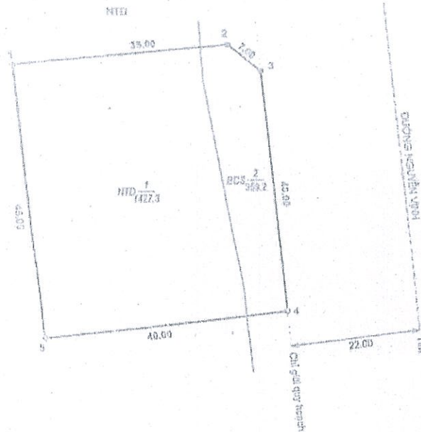
BẢNG CÁC MỐC RANH GIỚI ( HỆ TỌA ĐỘ VN 2000 )

( Hình theo quyết định số 32.34 / QĐ - UBND ngày 16 tháng 1 năm 2012 của UBND tỉnh Thừa Thiên - Huế )